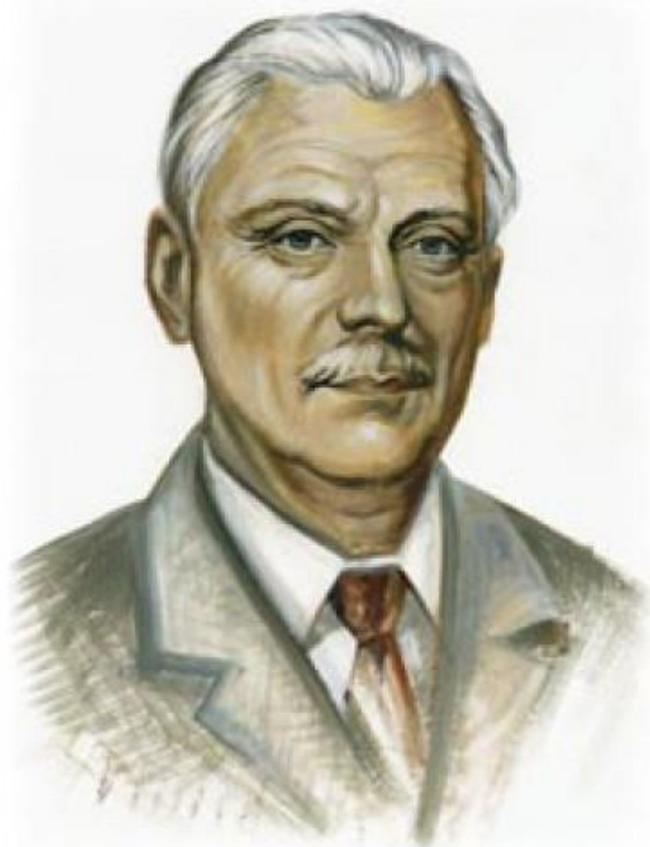
Михалков Сергей Владимирович (13.03.1913)